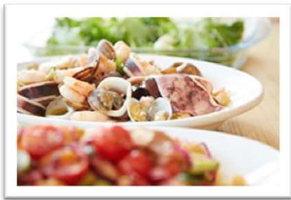
関連施設のレストランで おいしいお食事