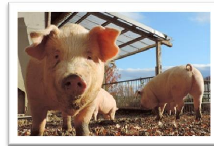
動物とのふれあい 『Kふぁーむ』

※ 各見学コースのお申し込みにあたっては、必ず見学内容の詳細をご確認ください。 (下記に掲載する内容は一部です)。