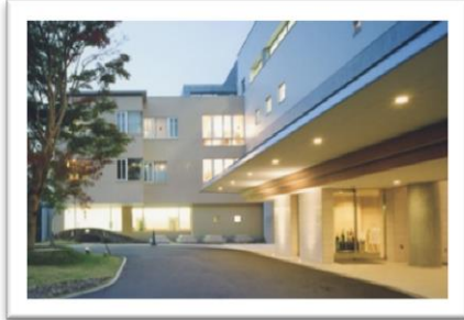
『あさかホスピタル』外観