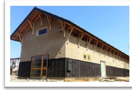
『はじまりの美術館』